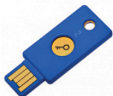
YubiKey Nano FIPS

Ausgestattet mit einer Dual-Protokoll-Plattform; FIDO U2F und FIDO 2; funktioniert mit gängigen Diensten wie Microsoft-Konten, Google, Twitter und Facebook.