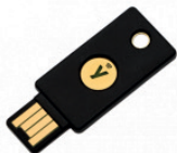
YubiKey 5 NFC

Die weltweit ersten Multiprotokoll-Sicherheitsschlüssel, die eine starke Authentifizierung und nahtlose Touch-to-Sign ermöglichen. Die YubiKey 5er-Serie ist schnell, sicher und funktioniert mit den meisten Diensten im Internet.